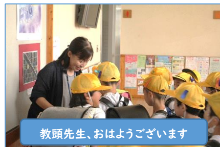
教頭先生、おはようございます

もし、6年生の名前が分からなかったら、えんりよなく聞いてくださいね。全校で、加茂野小学校の伝統である挨拶を盛り上げていきましょう。