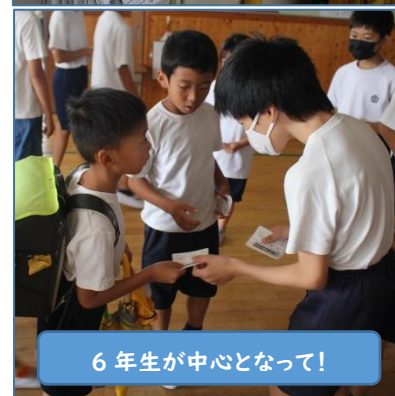
6年生が中心となって!

渡したカードは実に30000枚となりました。2週間ぶりに登校指導を兼ねて交差点に立ちましたが、これまで以上に明るく元気な挨拶をする子供たちが増え、この挨拶の取組の広がりを感じているところです。運動会の取組も始まりました。2学期も自分のよさを『出し切る!』で歩みます。